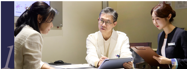
1 검진 전 과거질환, 가족력, 현재 건강상태를 고려한 전문의 예진을 통한 개인맞춤 검진