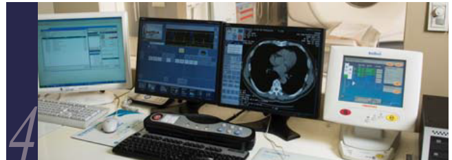
4 방사선 노출량을 최대 80% 줄인 최저선량 CT, MRI 등 최신 의료 장비를 이용한 첨단 검진 및 개인별 방사선 노출량 누적 관리 시스템 운영